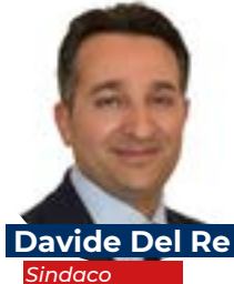
Davide Del Re Sindaco

Il progetto mira a trasformare il nostro centro storico in un luogo più vivibile, attrattivo e sostenibile, preservandone l’identità storico-culturale e promuovendone lo sviluppo socio-economico.