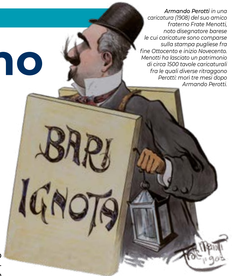
Armando Perotti in una caricatura (1908) del suo amico fraterno Frate Menotti, noto disegnatore barese le cui caricature sono comparse sulla stampa pugliese fra fine Ottocento e inizio Novecento. Menotti ha lasciato un patrimonio di circa 1500 tavole caricaturali fra le quali diverse ritraggono Perotti: morì tre mesi dopo Armando Perotti.

Il poeta e scrittore, nato a Bari nel 1865 e deceduto il 24 giugno 1924 proprio a Cassano delle Murge, ha lasciato un'impronta indelebile nella cultura regiona-