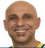
Rocco Lapadula Assessore all'Agricoltura

Olio Capitale rappresenta ogni anno un'opportunità inestimabile per le aziende di Cassano perchè offre la possibilità di continuare a far crescere e sviluppare il nostro territorio.